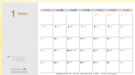
方便書寫的行事曆